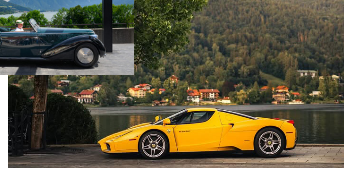
Concours d'Elegance 2024 auf Gut Kaltenbrunn