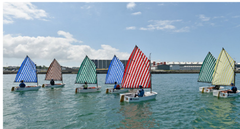
Daniel Buren, Voile/Toile – Toile/Voile

Buren (*1938 in Boulogne-Billancourt, Frankreich) ist ein französischer Konzeptkünstler, der für seine minimalistischen und ortsspezifischen Arbeiten bekannt ist. Er studierte an der École des Beaux-Arts in Paris und entwickelte in den 1960er Jahren seinen charakteristischen Stil -8,7 cm breite, vertikale Streifen in wechselnden Farben und Weiß. Die Streifen bezeichnet er als „visuelles Werkzeug“ die er in Architektur, öffentliche Räume und Museen installiert. Er hatte zahlreiche bedeutende Ausstellungen sowie Documenta und Biennale von Venedig (Goldener Löwe 1986).