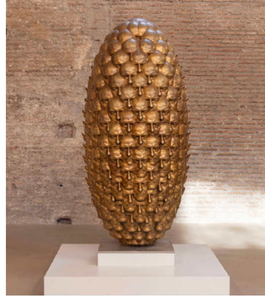
Tony Cragg, „WE“, 2015

Tony Cragg geboren 1949 in Liverpool studierte am Gloucestershire College of Art and Design sowie an der Wimbledon School of Art in London und schloss sein Studium 1977 an der Royal College of Art ab. 1988 erhielt er den renommierten Turner Prize, und 2007 wurde er in den Adelsstand erhoben. Cragg war Professor an der Kunstakademie Düsseldorf, deren Rektor er von 2009 bis 2013 war. Er lebt und arbeitet in Wuppertal, wo er auch einen Skulpturenpark betreibt. Seine Arbeiten sind weltweit in Museen und Sammlungen vertreten.