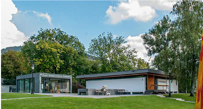
Gerhard Richter – Ausstellung 2024 mit über 30.000 Besuchern

Sammlung seiner Buchillustrationen. Das Museum zeichnet sich für seine besonderen Sonderausstellungen wie Marc Chagall, Gerhard Richter oder von Renoir bis Jawlensky aus. Eine Kooperation der Tegernsee Art Masters mit dem Museum ist vorgesehen.