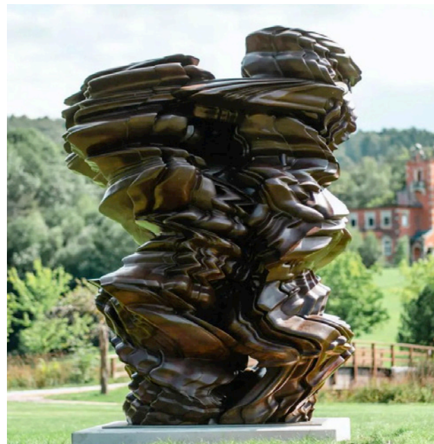
Tony Cragg, Stack, 2019; Courtesy Buchmann Galerie Berlin und Tony Cragg; Foto: Ernesto Uhlmann

Die kuratierten Ausstellungen bringen internationale Künstler und kreative Persönlichkeiten ins Tegernseer Tal. Im Mittelpunkt stehen die Skulpturen und Zeichnungen des renommierten Künstlers Tony Cragg. Ergänzt wird das künstlerische Konzept u.a. durch Werke von Olafur Eliasson und Jaume Plensa, die sich von den Formen und dem Licht der Natur inspirieren lassen.