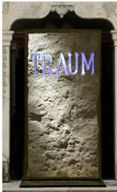
Fabrizio Plessi, Traum

Plessi (*1940 Reggio Emilia) studierte Malerei und Design an der Accademia di Belle Arti in Venedig, wo er später unterrichtete. Seit 1970er Jahren stellt er weltweit in Museen und Ausstellungen wie die Biennale di Venezia, die documenta in Kassel und führende Museen wie das Centre Pompidou in Paris. Er gilt als Wegbereiter für die Integration von digitalen Medien in der zeitgenössischen Kunst.