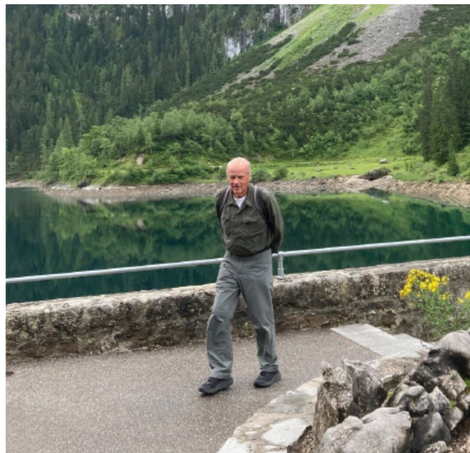
Hamish Fulton, Walking Artist

Eine Wandtafel zu entwickeln nach einem Walk um den Tegernsee. Kann als Edition verkauft werden. Walking Art Performance mit Publikum von Rottach nach Tegernsee.