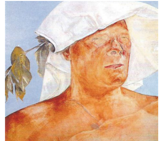
Olaf Gulbransson (Selbstportrait)